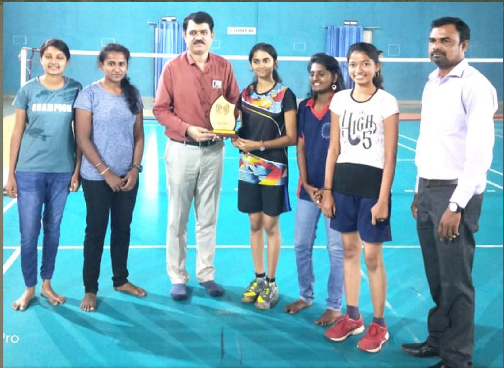
NMCE women's badminton team Got it First Place in Under Lead College Badminton Tournament 2019-20