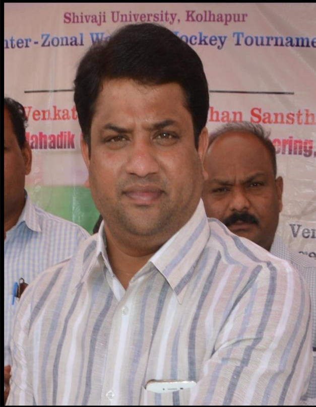
Hon. Rahul Mahadik (Dada)