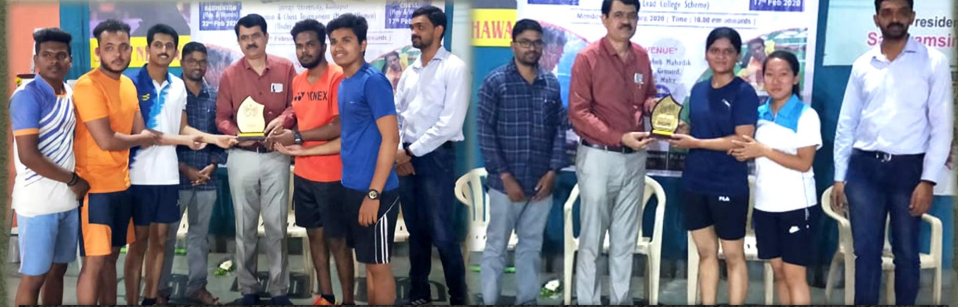
NMCE organized Under Lead College Badminton (m&w) Tournament 2019-20