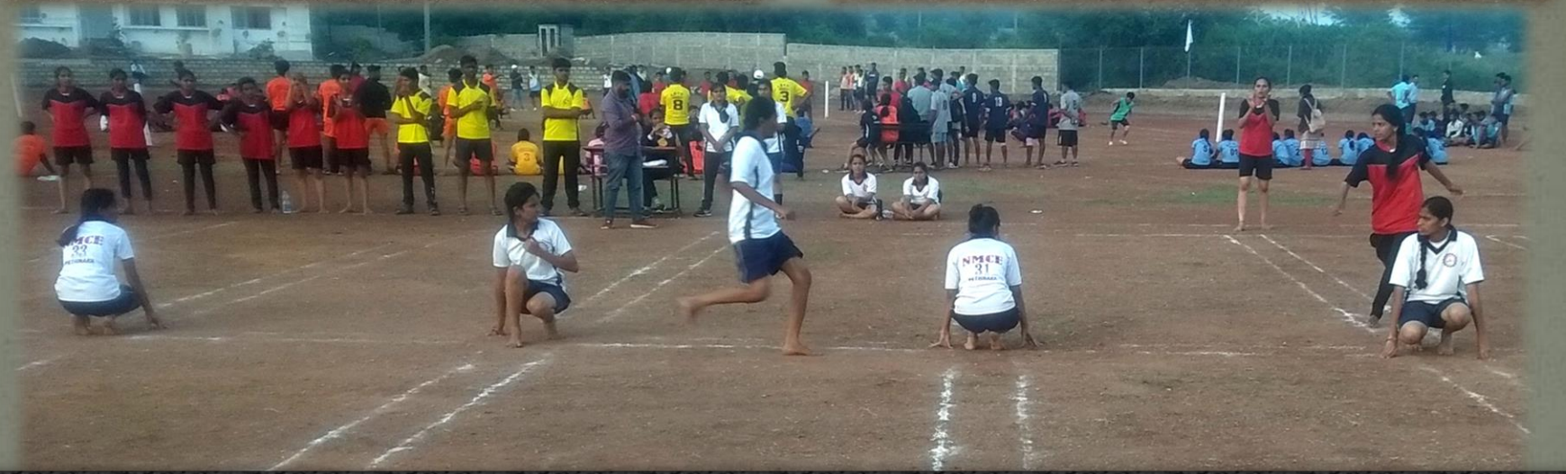
NMCE Kho-Kho Women's team participated in DBATU inter-collegiate tournament 2019-20