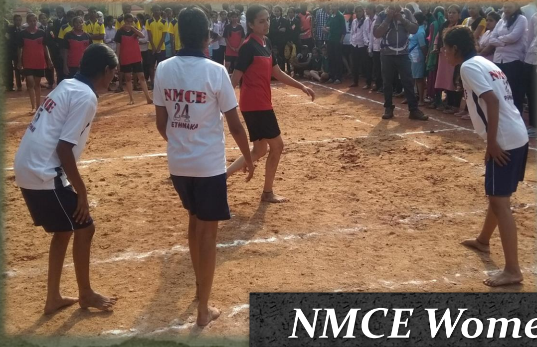
NMCE Women's Kabaddi Team