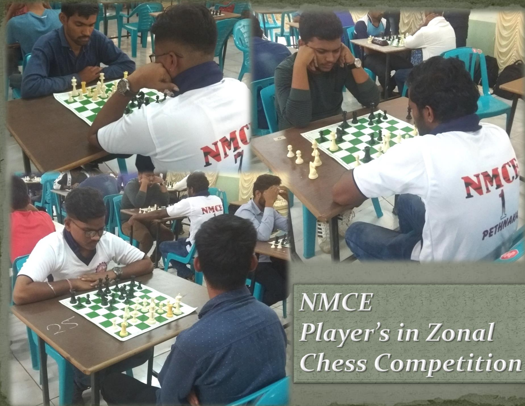
NMCE Player's in Zonal Chess Competition