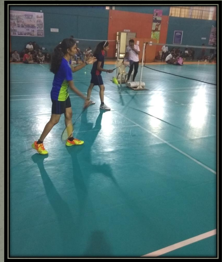
NMCE Badminton (W) Team